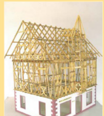
Gebäudemodell des Heimatmuseums