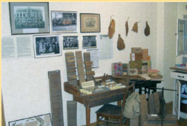
Platz einer Zigarrenmacherin