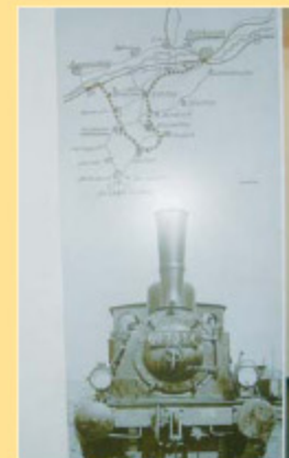
Streckenverlauf der Kleinbahn