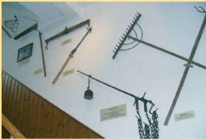
Landwirtschaftliche Geräte im Treppenaufgang