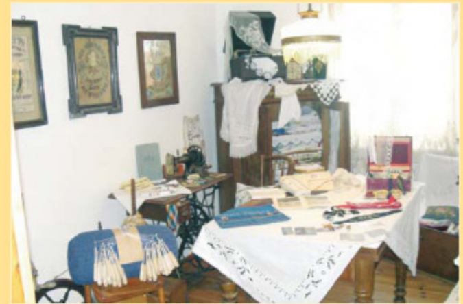
Näh- und Stickstube