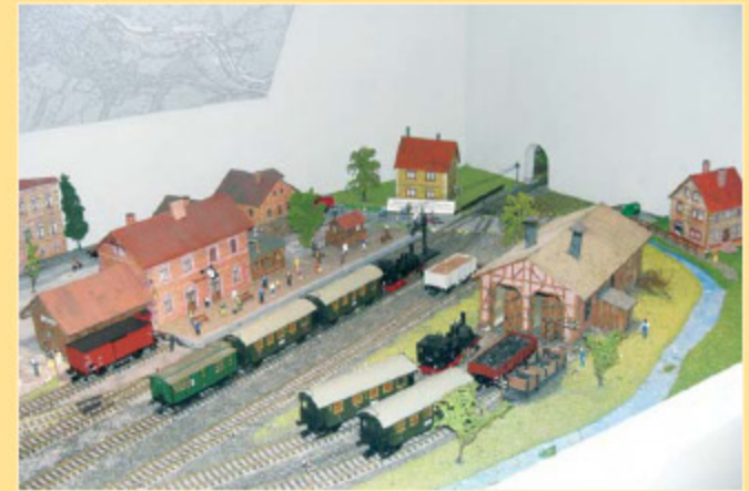
Modellanlage der Freigerichter Kleinbahn - Bahnhof Somborn